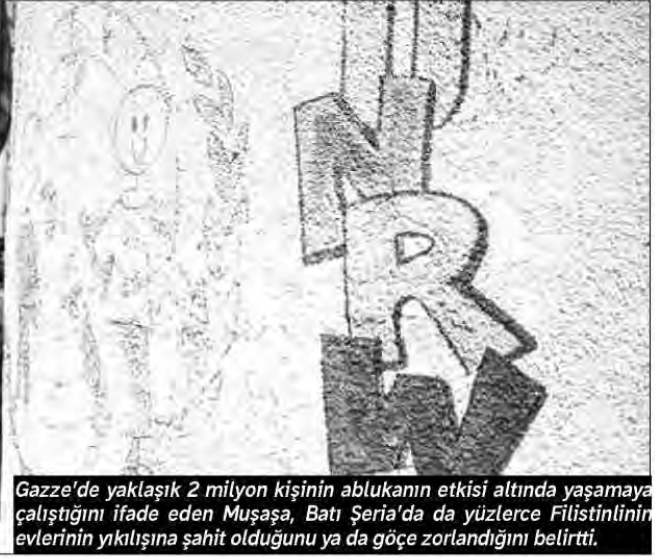
Gazze'de yaklaşık 2 milyon kişinin ablukanın etkisi altında yaşamaya çalıştığını ifade eden Muşşasa, Batı Şeria'da da yüzlerce Filistinlinin evlerinin yıkılışına şahit olduğunu ya da göçe zorlandığını belirtti.