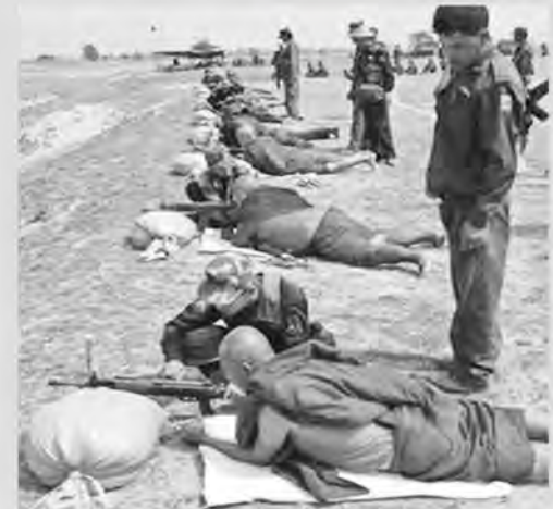
Etnik temizlik için eğitilen budistler

BM ve uluslararası insan hakları örgütleri, Arakanlı Müslümanlara yönelik şiddetli 'etnik temizlik' ya da 'soykırım' olarak adlandırıyor. İnsan hakları örgütleri, Arakanlı Müslümanların gerekli güvenli ortamı sağlanmadan Myanmar'a dönmelerinin, yeni bir etnik temizlik kampanyasına yol açacağı endişesini taşıyor.