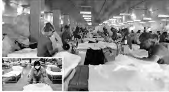
BBC Stratejik Politika Enstitüsü'nden verilen bilgiye göre Çin'in batısındaki fabrikalarda çalışmak için batı Sincan bölgesinden 80 binden fazla Uygur gönderildi.

Koronavirüsün yayılmasından kaynaklanan ekonomik gerilemeyi durdurmak amacıyla Çin, Uygurları Sincan'dan zorla çıkararak virüs riski yüksek bölgelerdeki fabrikalarda çalışmak üzere ülkenin diğer bölgelerine zorla göç ettiriyor.