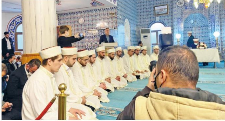
Törene Çekmeköy Kaymakamı Resul Çelik, Çekmeköy Müftüsü Vehbi Akşit, Çekmeköy Belediye Başkanı Ahmet Poyraz, öğrencilerin aileleri ve vatandaşlar katıldı