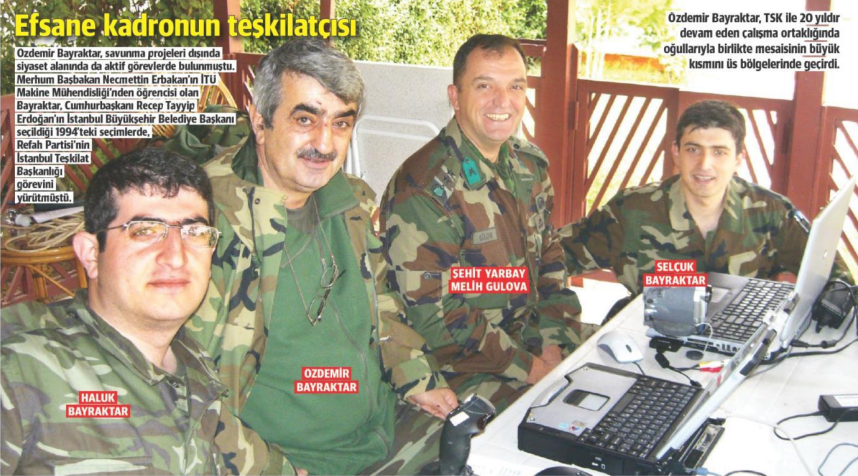
Efsane kadronun teşkilatçısı