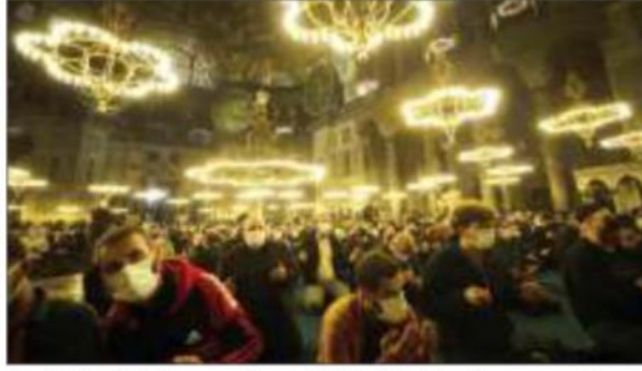
Mevlid Kandili'nin manevî havası Türkiye'nin dört bir yanını sardı.