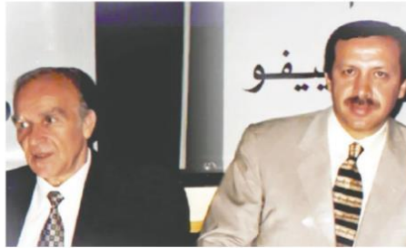
Vefatından önce Aliya İzzetbegović'in son görüştüğü devlet adamı Cumhurbaşkanı Recep Tayyip Erdoğan oldu.

İkinci Dünya Savaşı'nın akabinde kurulan Yugoslavya Federal Halk Cumhuriyeti, faşizme galip gelse de aralarında Aliya İzzetbegović'in de bulunduğu "Genç Müslümanlar" oluşumunun bazı üyeleri, "din bilincinin uyandırılması" yönündeki faaliyetleri nedeniyle 1946'da tutuklandı. 21 yaşındaki İzzetbegović, 3 yıl hapis cezası aldı.