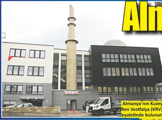
Almanya'nın Kuzey Ren Vestfalya (KRV) eyaletinde bulunan

Remscheid şehrinde inşa edilen Diyanet İşleri Türk İslam Birliği (DİTİB) bağlı Merkez Camii ibadete açıldı.