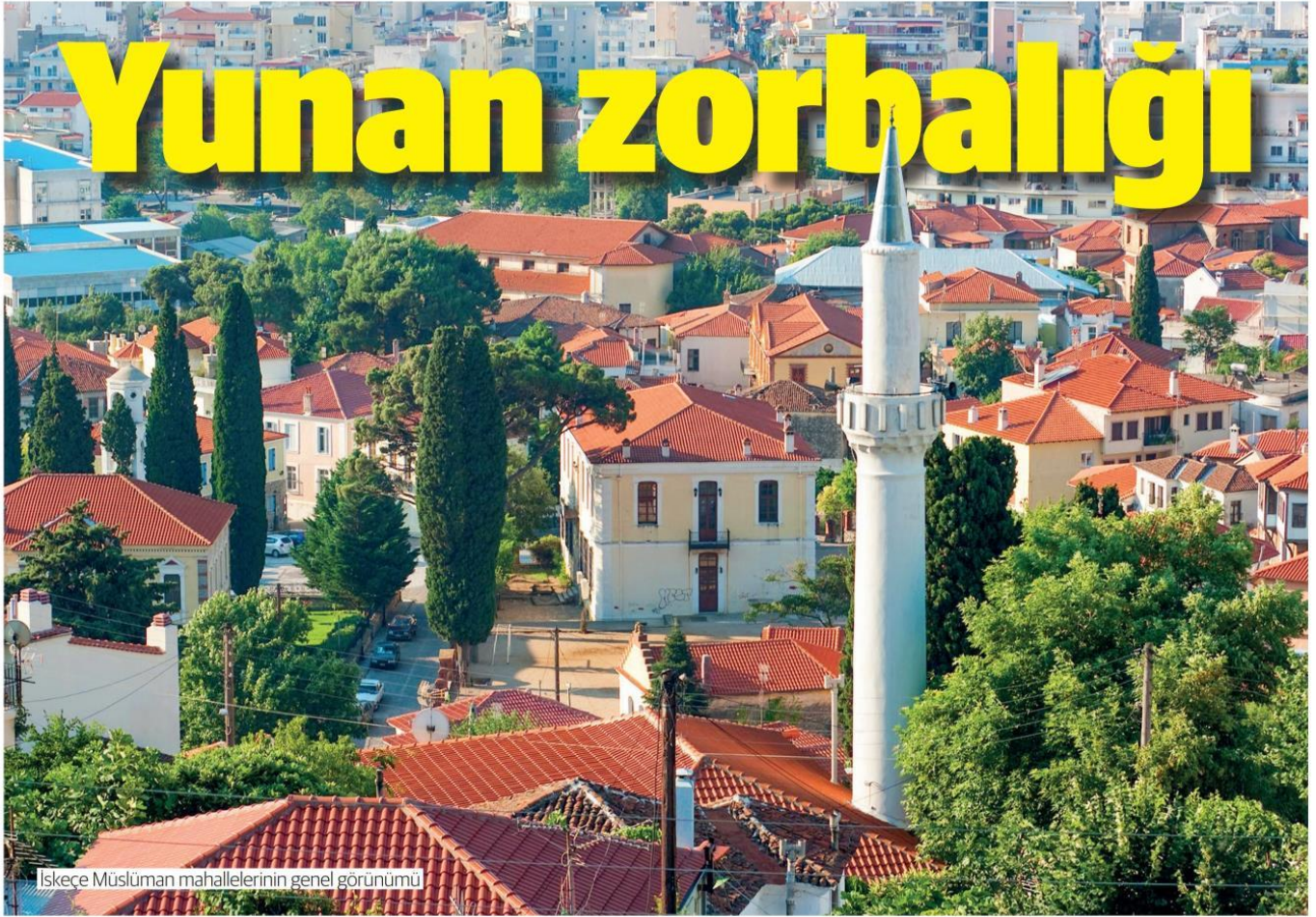
Iskeçe Müslüman mahallelerinin genel görünümü

Atina yönetimi, Batı Trakya Müslüman Türk azınlığını Lozan Anlaşması'yla garanti altına alınan haklarından mahrum bırakıyor. Bunların başında Türklerin kendi müftülerini seçme hakkı geliyor. Camilerde yapılan özgür seçimler, Yunan hükümeti tarafından tanınmıyor.