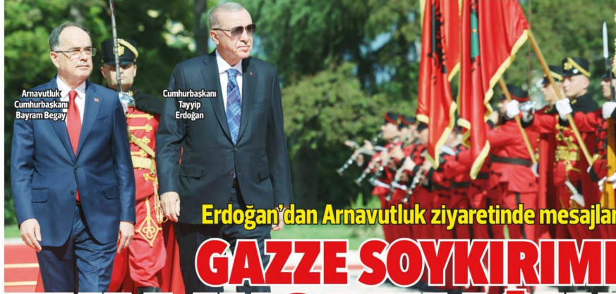
Arnavutluk Cumhurbaşkanı Bayram Begay