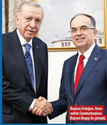
Başkan Erdoğan, Arnavutluk Cumhurbaşkanı Bajram Begaj ile görüşti.

Başkan Erdoğan'ın konuşmasının ardından sözlerine başlayan Edi Rama, Türkiye'nin desteğiyle yapılan Namazgah Camii 'nden bahsetti. Rama açıklamasında, "Arnavutluk'ta ilk seçildiğimde, bu proje geldiğinde bana kardeşlik işareti yaptınız. Siz caminin açılışına seninle geleceğim diye söz vermişsiniz. Ben sizinle birlikte birazdan gidip açılışa katılacağım. Çünkü inancın evleri... Bizim isminizi gelip geçici olacaktır ama sizin isminiz hep orada kalacaktır" diyerek Erdoğan'ın omzuna dokundu. Edi Rama'nın, Erdoğan'ın omzuna dokunması ise hem saygı hem de dostluğun bir ifadesi. Erdoğan da Rama'ya alkışlayarak ve gülümseyerek karşılık verdi.