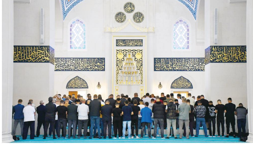
● Açılışı 10 Ekim'de gerçekleştirilen ve Balkanlar'ın en büyük camisi konumundaki Tiran Namazgah Camisi , Diyanet İşleri Başkanlığı ve Türkiye Diyanet Vakfı'nın (TDV) desteğiyle inşa edildi. Caminin içi ve dışında 10 bin kişi aynı anda namaz kılabilir.