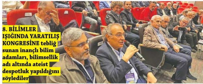
8. BİLİMLER İŞİĞİNDE YARATILŞ KONGRESİNE tebliğ sunan inançlı bilim adamları, bilimsellik adı altında ateist despotluk yapıldığını söylediler.