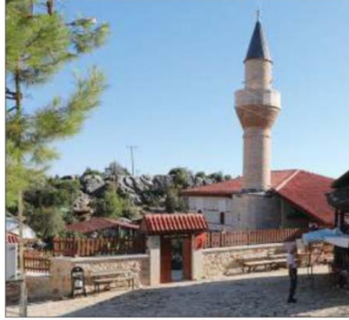
Antalya'daki 600 yıllık Sarıhacılar Camisi yenilenen çehresiyle ziyaretçilerini ağırlıyor.