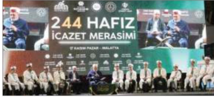
Malatya'da Kur'an kurslarında eğitimlerini tamamlayan 244 öğrenci için Hafızlık İcazet Töreni düzenlendi.