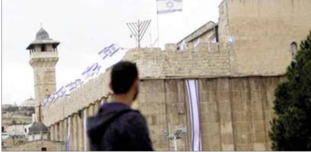
Filistin Vakıflar ve Dini İşler Bakanlığı, İsrail'in işgal altındaki Batı Şeria'nın El Halil kentindeki Harem-i İbrahim Camisi'ni "tamamen ele geçirme ve Yahudileştirme" girişimlerine karşı uyarıda bulundu.