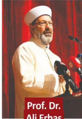
Prof. Dr. Ali Erbaş

Erbaş, Edirne Valiliğinin desteği, Trakya Üniversitesinin ev sahipliğinde Edirne Mimar Sinan Vakfı, Balkan Şehirleri İş Birliği Edirne Platformu paydaşlığında İslam Alimleri Vakfı ca Balkan Kongre Merkezi’nde düzenlenen “Kendi Gök