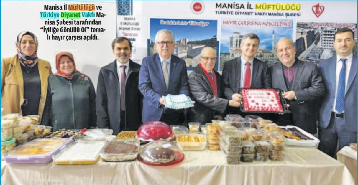
Manisa İl Müftülüğü ve Türkiye Diyanet Vakfı Manisa Şubesi tarafından "İyiliğe Gönüllü Ol" temalı hayır çarşısı açıldı.