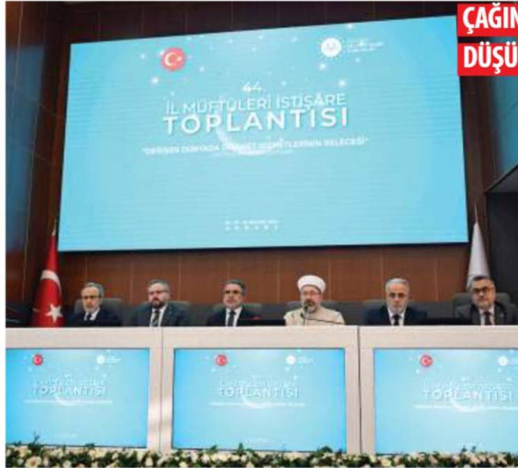
Diyanet İşleri Başkanı Ali Erbaş, Diyanet İşleri Başkanlığı'nda düzenlenen 44. İl Müftüleri İstişare Toplantısı'na katılarak, sonuç bildirisini açıkladı.

Tüm dünyanın gözleri önünde tarihte eşine ender rastlanan vahşetlere, katliamlara, soykırımlara şahit olduğunun altını çizen Erbaş, "İşgalci siyonistlerin Gazze'de fütursuzca işlediği cinayetler ve uyguladıkları soykırım karşısındaki sessizlik, aslında insanlığın nasıl karanlık bir çağdan ve kurak bir iklimden geçtiğinin apaçık kanıtıdır. Bu durum, yeryüzünde adalet ve merhametin egemenliği için çalışanların yüklendiği sorumluluğun önemini ve ağırlığını gözler önüne sermektedir." diye konuştu.