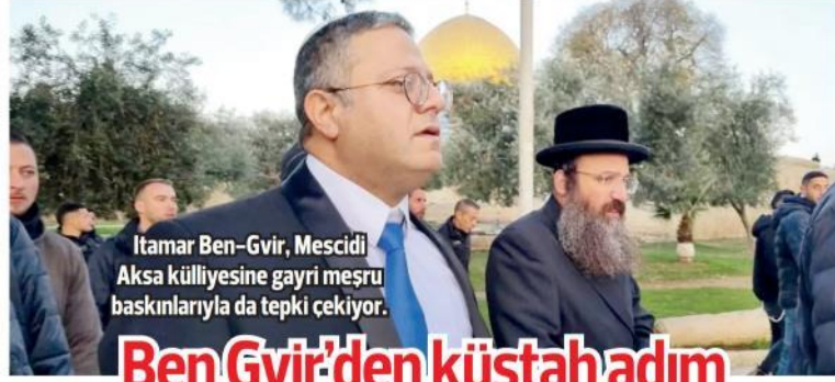
Itamar Ben-Gvir, Mescidi Aksa külliyesine gayri meşru baskınlarıyla da tepki çekiyor.