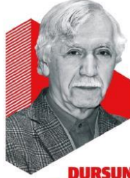
DUR SUN GÜRLEK

İşte dört başı mâmur İslam âlimi böyle olur. Rahmetullahi aleyh!..