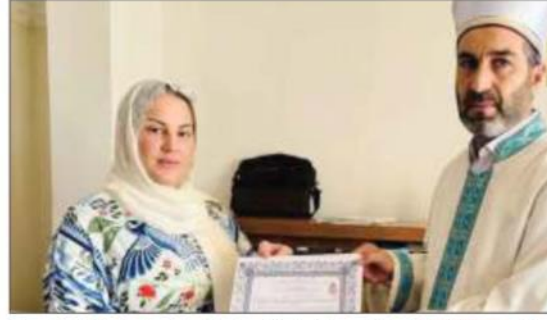
Şırnak'ta Belçikalı kadın, Kur'an-ı Kerim'den etkilenip Müslüman oldu