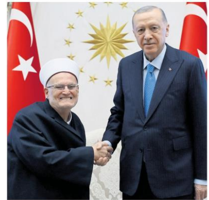
Cumhurbaşkanı Recep Tayyip Erdoğan, Mescid-i Aksa İmam Hatibi Şeyh İkrime Sabri'yi Cumhurbaşkanlığı Külliyesi'nde kabul etti. Basına kapalı gerçekleşen kabulde, Diyanet İşleri Başkanı Ali Erbaş da hazır bulundu.

Erdoğan-Bahçeli zirvesinin ardından taraflar herhangi bir açık-