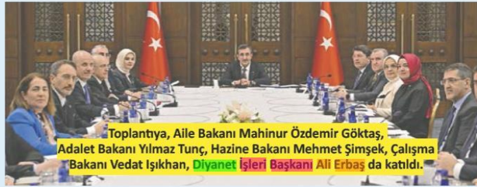
Toplantıya, Aile Bakanı Mahinur Özdemir Göktaş, Adalet Bakanı Yılmaz Tunç, Hazine Bakanı Mehmet Şimşek, Çalışma Bakanı Vedat Işıkhan, Diyanet İşleri Başkanı Ali Erbaş da katıldı.

ganlık hızı ve nüfus artış hızında belirgin bir düşüş gözlemlendiği, 2001'de 2,38 çocuk olan doğurganlık hızının 2023'te 1,51'e düştüğünü ve bunun tarihin en düşük değeri olduğuna dikkati çeken Yılmaz, doğurganlığın nüfusun yenilenme düzeyinde kritik eşik olan 2,1'in altında kaldığını anlattı.