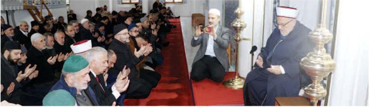
Mescid-i Aksa İmam Hatibi Şeyh İkrime Sabri, Trabzon'da Cuma namazını kıldırdı. Sabri, namaz öncesi cemaate hitap etti.