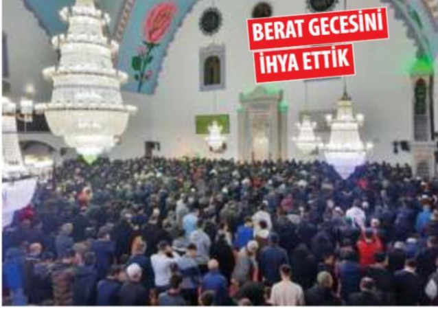
Ramazan ayının müjdecisi kabul edilen Berat Kandili'nde vatandaşlar camilere akın etti.