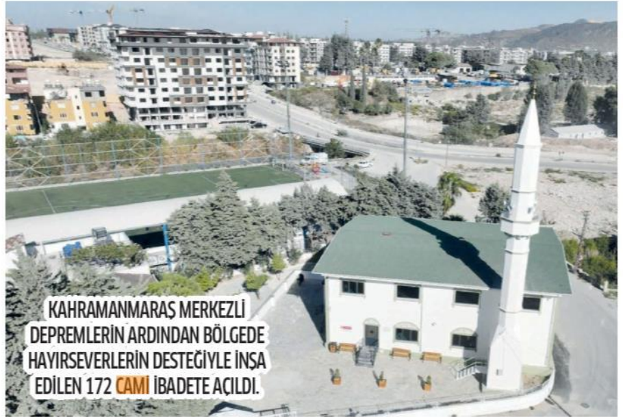
KAHRAMANMARAŞ MERKEZLİ DEPREMLERİN ARDINDAN BÖLGEDE HAYIRSEVERLERİN DESTEĞİYLE İNŞA EDİLEN 172 CAMİ İBADETE AÇILDI.

K AHRAMANMARAŞ merkezli 6 Şubat depremlerinin etkilediği 11 ilde hasar gören 2 bin 200 caminin bakım ve onarımı tamamlandı. AA muhabirinin Diyanet İşleri Başkanlığı'ndan aldığı bilgiye göre, deprem bölgesinde bulunan 11 bin 48 camiden 3 bin 811'i sarsıntılardan zarar gördü. Camilerin 354'ü ağır, 342'si orta ve 2 bin 133'ü hafif hasar alırken, 982 cami ise tamamen yıkıldı. Böylece depremlerin etkilediği Hatay'da 256, Kahramanmaraş'ta 234, Malatya'da 128, Gaziantep'te 147, Adıyaman'da 64, Osmaniye'de 55, Kilis'te 14, Şanlıurfa'da 29, Diyarbakır'da 27, Elazığ'da 28 cami enkaza dönüştü. İki yılda 11 il ve ilçelerinde orta ve hafif derecede hasar alan 2 bin 200 cami, bakım ve onarımı tamamlanarak yeniden hizmete sunuldu.