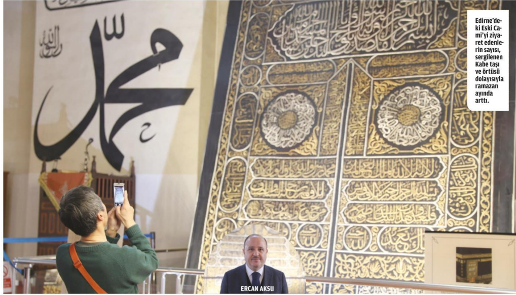
Edirne'deki Eski Cami'yi ziyaret edenlerin sayısı, sergilenen Kabe taşı ve örtüsü dolayısıyla ramazan ayında arttı.