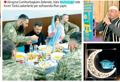
● Ukrayna Cumhurbaşkanı Zelenski, Kiev Müftülüğü'nde Kırmızı Türkü askerlerle yer sofrasında iftar yaptı.

caddesi. İftar vakti geldiğinde bu caddelerde üzerinde "Hilal" bulunan "Ramazan Mübarek Olsun" yazan mahyalar yanyan.