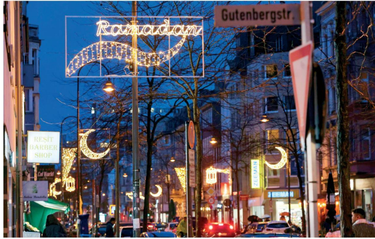
● Almanya'da bulvarlar, Ramazan mahalyaları ile ışıl ışıl.

Avrupa'da Ramazan ayı, sadece bir dini ibadet değil sosyal ve siyasi bir geleneğe dönüştü. İngiltere'den Almanya'ya, Romanya'dan Ukrayna'ya kamu diplomasisinin bir parçası oldu. Devlet yetkilileri de iftar davetlerine katılarak, İslam'ın şehir yaşamına entegre olduğunu gösterdi. Şehirlerdeki Ramazan çarşıları, iftar davetleri ve camilerdeki teravih namazları şehir yaşamının ayrılmaz bir parçası haline geldi.