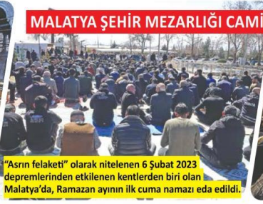
MALATYA ŞEHİR MEZARLIĞI CAMİİ

"Asrın felaketi" olarak nitelenen 6 Şubat 2023 depremlerinden etkilenen kentlerden biri olan Malatya'da, Ramazan ayının ilk cuma namazı eda edildi.