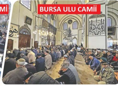
BURSA ULU CAMİİ

"Asrın felaketi" olarak nitelenen 6 Şubat 2023 depremlerinden etkilenen kentlerden biri olan Malatya'da, Ramazan ayının ilk cuma namazı eda edildi.