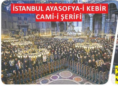
İSTANBUL AYASOFYA-İ KEBİR CAMİ-İ ŞERİFİ