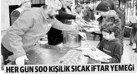
HER GÜN 500 KİŞİLİK SICAK İFTAR YEMEĞİ

Türkiye Diyanet Vakfı ile Türk Kızılay Konak Şubesi'nin işbirliği ile yürütülen bu proje kapsamında, dar gelirli ailelere düzenli gıda kolisi dağıtımını yaparak Ramazan boyunca sofralarının dolu kalmasını sağlayacak.