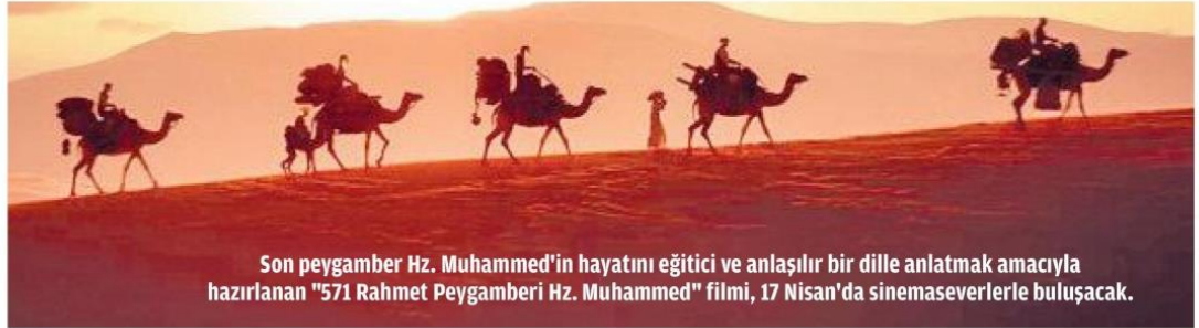
Son peygamber Hz. Muhammed'in hayatını eğitici ve anlaşılır bir dille anlatmak amacıyla hazırlanan "571 Rahmet Peygamberi Hz. Muhammed" filmi, 17 Nisan'da sinemaseverlerle buluşacak.