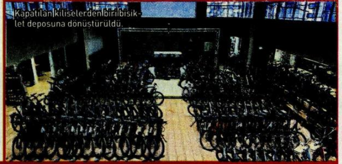
Kapatılan kiliselerden birinin bisiklet deposuna dönüştürüldü.