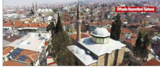
Üftâde Hazretleri Türbesi

Peygamber Efendimizin (asm) 24. nesil silsilesine mensup olduğundan Seyyid sayılan Somuncu Baba'nın asıl adı Hamid idi. 1331 yılında Kayseri'nin Akçakaya köyünde doğmuş, ilk eğitimini Horasan erenlerinden olan babası Şemseddin Musa Efendiden almıştı. Onun teşviki ile Şam'da, Tebriz'de, Hoy'da, Erdebil'de eğitim görmüştü.