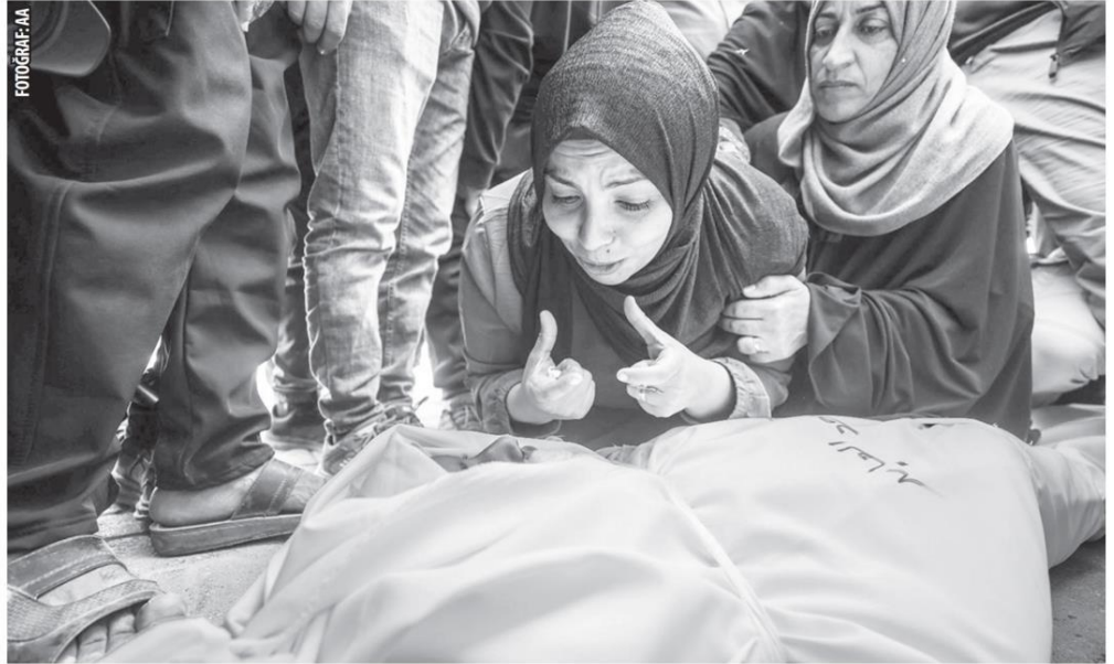
İsrail'in ateşkeske rağmen Gazze Şeridi'nin kuzeyindeki Beyt Lahiya beldesine düzenlediği hava saldırısında 3'ü çocuk 5 Filistinli hayatını kaybetti. Yakınlarını kaybeden Filistinliler büyük üzüntü yaşadı.

Gazze Şeridi'nde 10 Ekim 2025'te yürürlüğe giren ateşkes anlaşmasına rağmen İsrail işgal güçleri saldırılarını aralıksız sürdürüyor. Camii avlusunda toplanan sivillere İHA saldırısında 3'ü çocuk 5 Filistinli katledildi. Ateşkes sonrası 2 bin 400 ihlalle 786 Filistinli hayatını kaybederken, binlerce yaralı var.