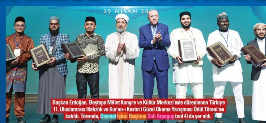
Başkan Erdoğan, Beştepe Millet Kongre ve Kültür Merkezi'nde düzenlenen Türkiye 11. Uluslararası Hafızlık ve Kur'an-ı Kerim'i Güzel Okuma Yarışması Ödül Töreni'ne katıldı. Törende, Diyanet İşleri Başkanı Safi Arpagus (sol 4) da yer aldı.

BAŞKAN Erdoğan, Beştepe Millet Kongre ve Kültür Merkezi'nde Türkiye 11. Uluslararası Hafızlık ve Kur'an-ı Kerim'i Güzel Okuma Yarışması Ödül Töreni'ne katıldı. 9 ülkeden 41 yarışmacının katıldığı yarışmanın Diyarbakır'daki finaline değinen Erdoğan, "Kur'an-ı Kerim'i hüsu içinde okuyan hafızlarımızı tebrik ediyorum" diye konuştu. Dünya genelindeki gelişmelere değinen Erdoğan, Filistin, Lübnan, Sudan, Somali ve Yemen'de yaşananlara dikkat çekerek, "Müslümanlar olarak zorlu ve sancılı bir dönemde geçiyoruz. Medeni dünya 3 maymuno oynuyor" dedi. Erdoğan,