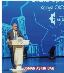
OSMAN AŞKIN BAK