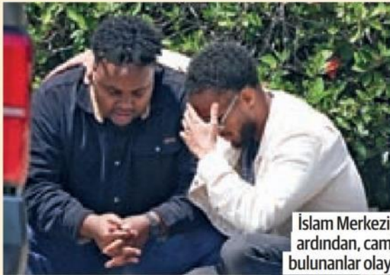
İslam Merkezine saldırının ardından, camide yakınları bulunanlar olay yerine koştu.