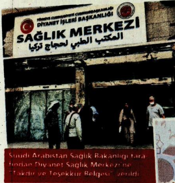
Suudi Arabistan Sağlık Bakanlığı tarafından Diyanet Sağlık Merkezi'ne 'Takdir ve Teşekkür Belgesi' verildi.