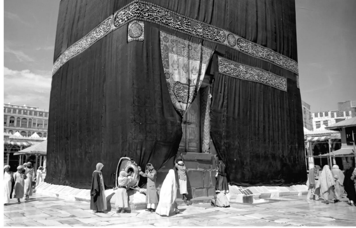
Kabe-i Mükerreme'nin 1947 yılına ait bir fotoğrafı.

◉ Hac ibadetini açıkça ve kanunî bir çerçevede yasaklayan müstakbil bir düzenleme olmasına rağmen Cumhuriyet'in ilanından çok partili hayata geçişe kadar uzanan yaklaşık 30 yıllık süreçte devlet eliyle herhangi bir resmi hac organizasyonu yapılmadığı gibi şahsi çabalarla hacca gitmek de neredeyse imkânsızdı.