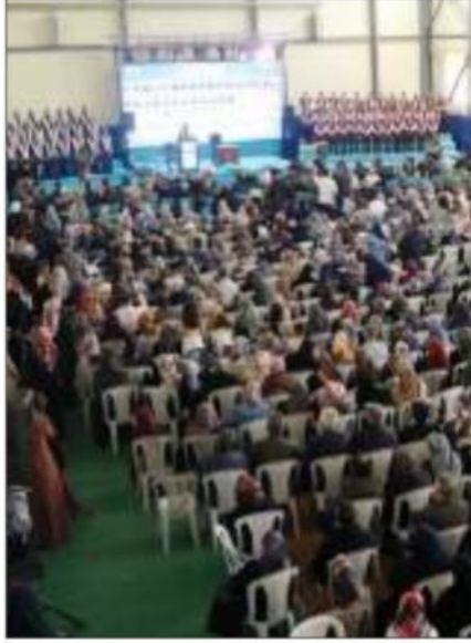
Çankırı'da hafızlık eğitimlerini tamamlayan 68 öğrenci için icazet merasimi düzenlendi.