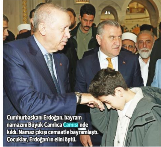
Cumhurbaşkanı Erdoğan, bayram namazını Büyük Çamlıca Camisi'nde kıldı. Namaz çıkışı cemaatle bayramlaştı. Çocuklar, Erdoğan'ın elini öptü.

liği, beraberliği gördük. Ve şimdi biliyorsunuz hacdan dönüşler başlıyor. Allah tüm hacca giden kardeşlerimizin hakkını kabul etsin. Rabb'im oradaki birlikteliği, beraberliği tüm Müslümanlara nasip etsin. Her şeyden önce tabii bir Filistin'i yaşadık, bir Gazze'yi yaşadık. Filistin'de, Gazze'de yaşananlar bizler için bu bayramda ayrı bir duruş, ayrı bir vakfe. Rabb'im inşallah bir an önce bu Netanyahu denilen zalim de inanıyorum ki dünya Müslümanları karşısında gereken dersi alacaktır. İnşallah bir an önce de bizler bu duruşu görelim. Bu duruşu hep beraber yaşayalım. 4 milyon, 5 milyon Müslüman bunu bizzat yaşasın diye bekliyoruz. Rabb'im yâr, yardımcımız olsun. Kurban Bayramı âlemi İslam'ın ittihadına inşallah vesile olsun diyorum. Sizleri de saygıyla, sevgiyle selamlıyorum."