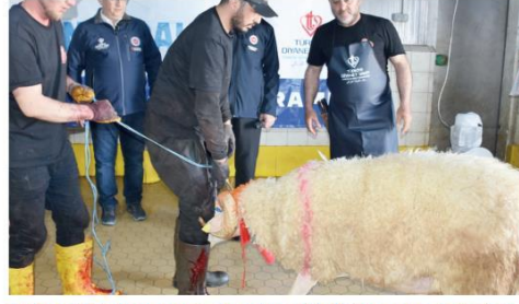
Yurt genelinde bayram namazlarını kılan yüz binlerce vatandaş kurban kesim yerlerine akın etti. Sabah erken saatlerde başlayan kesimler akşama kadar sürdü. Kurbanlarını tekbirlerle kestiren vatandaşlar, hisselerinin bir kısmını ihtiyaç sahiplerine dağıttı. Bu arada yurt genelinde 13 bin 513 kişi kurban kesimleri sırasında hastanelik oldu.

İstanbul'da Ayasofya-i Kebir Cami -i Şerifi, Sultanahmet, Süleymaniye, Fatih, Eyüpsultan, Taksim ve Büyük Çamlıca camileri başta olmak üzere kent genelindeki camiler dolup taşı. Sabahın erken saatlerinde camilere gelen vatandaşlar uzun kuyruklar oluştururken, Ayasofya'da içeride yer bulamayanlar meydana seccadelerini sererek saf tuttu. Yerli vatandaşların yanı sıra çok sayıda yabancı turist de bayram namazına katıldığı görüldü. Namazın ardından cemaat bayramlaşırken, bazı