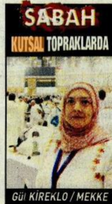
GÜL KIREKLO / MEKKE

İŞTE, Kâbe 'den ayrılmanın hüznü kime sorsam daha şimdiden başladı. Kâbe , miknatis gibi çekiyor insanı. Tavafını bitirip de yarın yeniden geleceğini bilsen bile özlem başlıyor. Benim hissiyatıma göre burası, kalplerin 'Bir' olduğu yer. Kalpler aynalanıyor ve o güzel enerjiden kime ayrılmak istemiyor. Sonra aklımıza Medine'de Hz. Muhammed'in ravzası geliyor. O zaman Peygamberimize gideceğimizi düşünüp yeniden heyecanlanıyoruz.