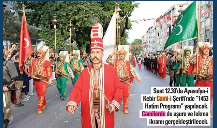
Saat 12.30'da Ayasofya-i Kebir Cami-i Şerifi'nde "1453 Hatim Programı" yapılacak. Camilerde de aşure ve lokma ikramı gerçekleştirilecek.

Kutlamaların en dikkat çekici etkinliklerinden biri olan "Fethin Yürüyüşü", saat 11.00'de Beyazıt Meydanı'ndan başlayarak, Ayasofya-i Kebir Cami-i Şerifi Meydanı'na kadar devam edecek. Ayrıca Cumhurbaşkanlığı İletişim Başkanlığı himayelerinde, Milli Eğitim Bakanlığı ve Diyanet İşleri Başkanlığı iş birliğiyle düzenlenecek "İstanbul'un Fethinden Türkiye Yüzyılı'na 1453 Genç Hafızdan 1453 Hatim" programı saat 12.00'de Fatih Camisi Külliyesi'nde gerçekleştirilecek.