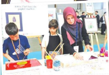
Geleneksel sanatlarımızın sergilendiği etkinlik, hem Türk vatandaşlarından hem de yabancıardan yoğun ilgi gördü.