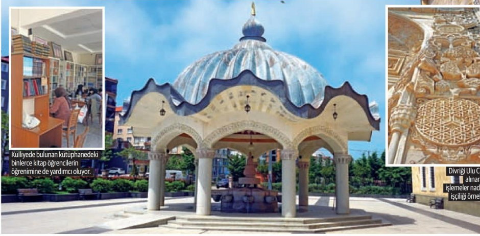
Külliyede bulunan kütüphanedeki binlerce kitap öğrencilerin öğrenimine de yardımcı oluyor.