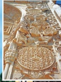
Divriği Ulu Camii örnek alınarak yapılan işlemler nadir mermer işçiliği örneklerinden.