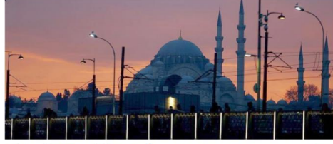
"HİCRET, İSLAM TARİHİNDE YENİ BİR DÖNEMİN BAŞLANGICI"

H İCRİ 1448 yılı, bugün başlayacak. Peygamber Efendimiz Hazreti Muhammed (S.A.V.) ve ashabının 1448 yıl önce Mekke'den Medine'ye hicreti, İslam âleminde hicri takvimin başlangıcı kabul ediliyor. Diyaret İşleri Başkanlığı Din İşleri Yüksek Kurulu vakit hesaplamalarına göre, hicri takvimin ilk ayı kabul edilen muharrem ayının ilk günü, bugün idrak edilecek. Muharrem ayının başladığını bildiren hilal, ilk kez Atlas Okyanusu'nda ortaya çıkacak ve Asya, Avrupa, Afrika, Kuzey ve Güney Amerika'da görülebilecek. Muharremde oruç tutulup aşure pişirilerek dağıtılması ve Kerbela'da Hazreti Muhammed'in torunu Hazreti Hüseyin ile şehit olanların yâd edilmesi, İslam toplumlarının önemli gelenekleri arasında yer alıyor. Aşure günü, hicri yılın ilk ayı muharremin 10. gününe denk gelen 25 Haziran Perşembe günü karşılanacak.