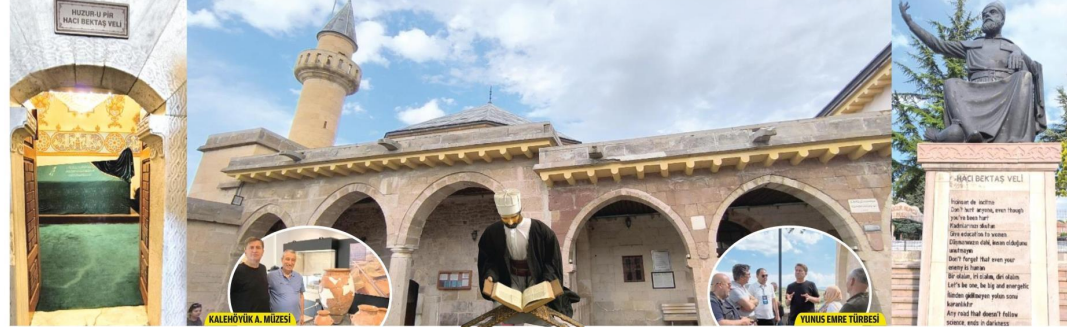
KALEHÖYÜK A. MÜZESİ