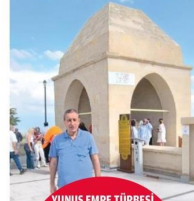
YUNUS EMRE TÜRBESİ

1271 yılında vefat ettiği yer olan Neveşehir 'in Hacı Bektaş-ı Velî 'nin cenazesi 13 Kasım 1925 tarihinde TMM'nin 677 Sayılı Kanunu 'yla diğer tekke ve zaviyelere birlikte kapatılmasına kadar erenlerin kendini bulduğu, hamlikatın pişmeye, pişmekten yanmaya evildiyiği yer olmuş... İnkâya uğradığı tarihten sonra uzam süre fetret dönemi geçen Derğah , Valıkarın Genel Müdürlüğü tarafından Hacı Bektaş-ı Velî anıtının restorasyonu çerçevesinde