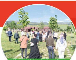
Kırköy Mesire ve Pınık Alanı hem dezanvattılı grupların üretim yapacakları ve eğitim atacakları bir yer, hem de mesire ve piknik alanı olarak projelendirilmiş.