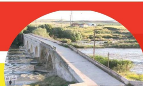
1265 yılında Anadolu Selçuklu Sultanı 3. Gıyaseddin Keyhüsrev döneminde Kırşehir Emiri Nureddin Çağrı tarafından yaptırılan ve Kırşehir'in 20 kilometre güneyindeki Kesiköprü köyünde Kızılrmak'ın üzerinde bulunan Kesiköprü ve Çağrı Kervansarayı yakında kalma müzesine veriliyor.

erek, dağlarıyla, ovalarıyla, vadileriyle, akarsularıyla, göletleriyle, ormanlarıyla, şifalı sularıyla, termal sularıyla, yeraltı suları ile, kaleleriyle, camileriyle, medreseleriyle, pirileriyle, enreleriyle, abdalılarıyla, gelenekleriyle, tarihiyle, kültürüyle, turizmle, gastronomisiyle, ekonomisiyle, sanayisiyle gelişme eğilimi adimlariyle ilerliyor.